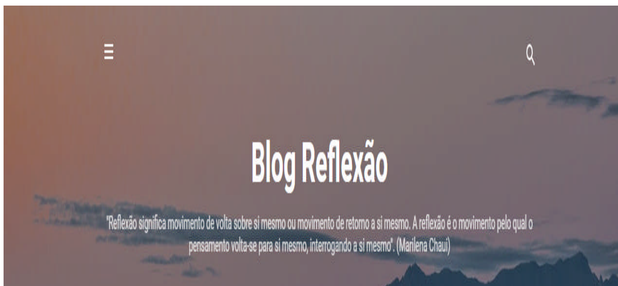
Figura 1: Perfil de capa do Blog

Para tanto o a administração do blog, ficará a cargo dos coordenadores, dois professores e assessoria do apoio pedagógico do Núcleo de Tecnologia da Secretaria de Educação de Goiânia. Os textos, encaminhamentos, trabalhos, vídeos, programação de eventos, poderão ser enviados pelos professores e parceiros aos administradores do Blog para que os mesmos organizem as postagens. A estrutura do Blog se apresenta da seguinte forma: