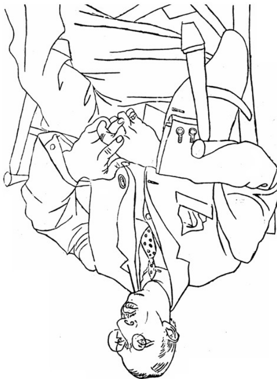
FIGURA 1 - Exemplo de exercício a ser desenhado de cabeça para baixo

FONTE: Drawing with the right side of the brain , Betty Edwards (2012)